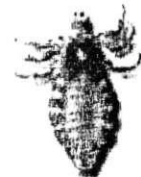
Pidocchia del Capo